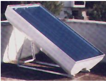
Felállítás teraszon, postetön